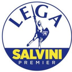
GRUPPO CONSIGLIARE "LEGA SALVINI PREMIER" DI CASTELFRANCO EMILIA