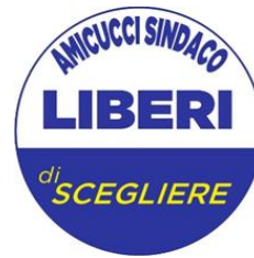
GRUPPO CONSIGLIARE "LIBERI DI SCEGLIERE" DI CASTELFRANCO EMILIA