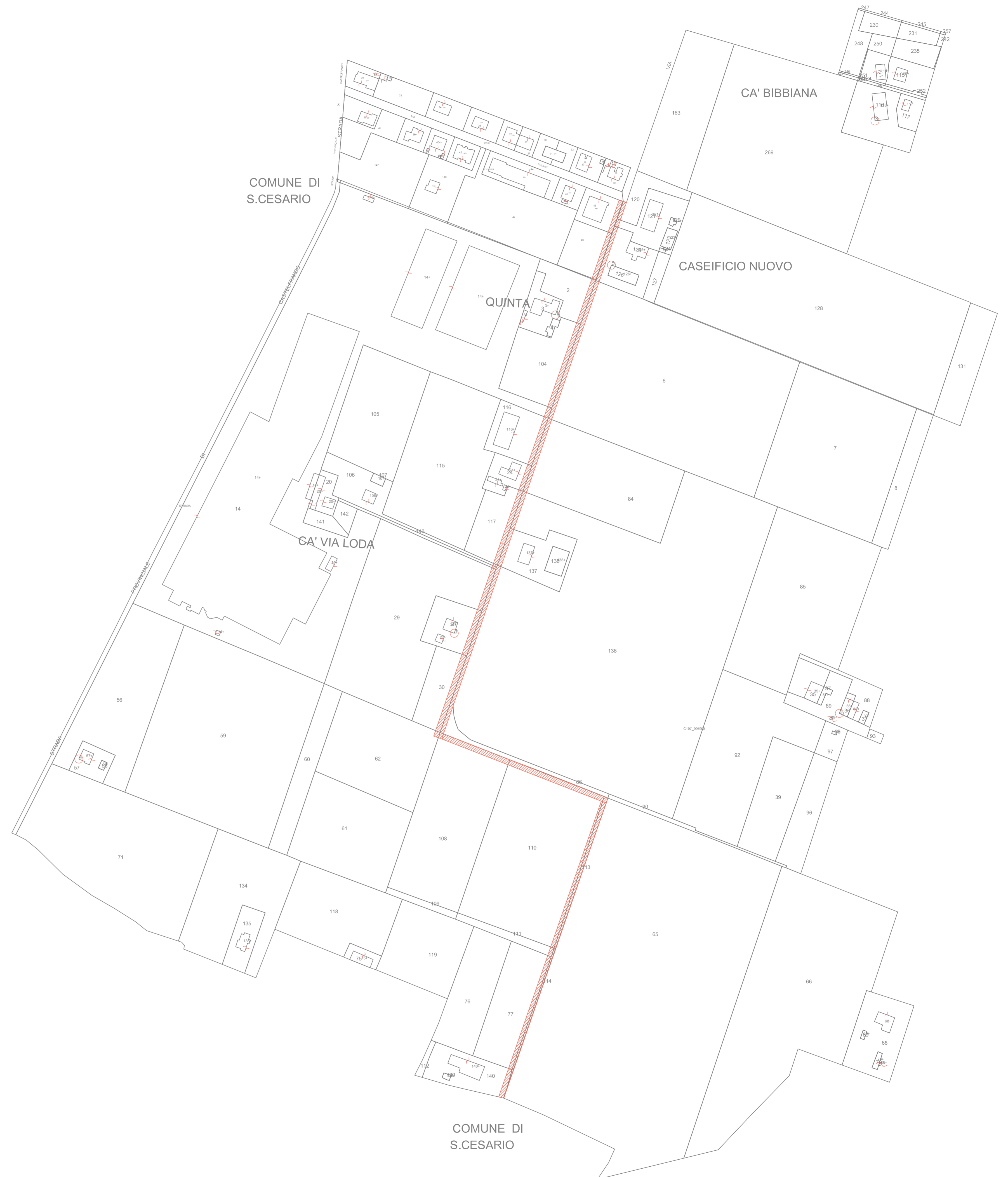
PROGETTO DELLA PISTA CICLABILE SULLA PLANIMETRIA CATASTALE SCALA 1:1000