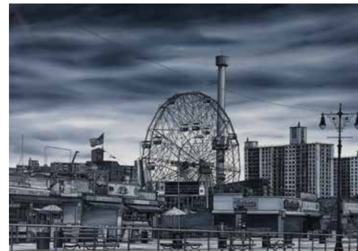
Andrea Chiesi UCRONIE 13 2013 olio su lino 70x100 cm

Il Paese dei Ragazzi è organizzato in collaborazione con l'associazione I burattini della Commedia dell'Arte ( www.iburattinidellacommedia.it ).