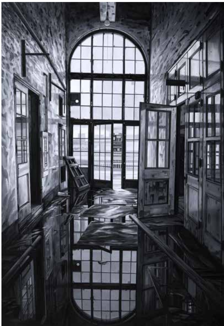
Andrea Chiesi UCRONIE 23 2013 olio su lino 100x70 cm

gio", tra archivi e biblioteche abbandonate, la poesia comprende la vanità del mondo e comincia faticosamente ad accettare la luce cui deve abituarsi per potersi pulire, imbiancare, purificare. E proprio la ricerca della luce, che non sempre si manifesta in tutta evidenza, diventa interrogazione e dialogo profondo con l'eterno».