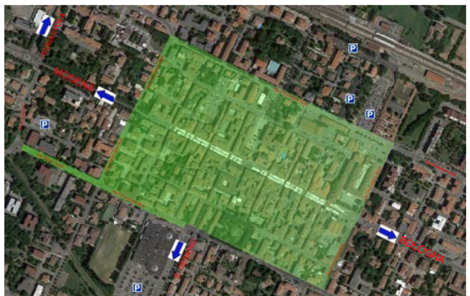
Area interessata dalle limitazioni

Per tutelare la salute dei cittadini e la qualità dell'ambiente in cui viviamo