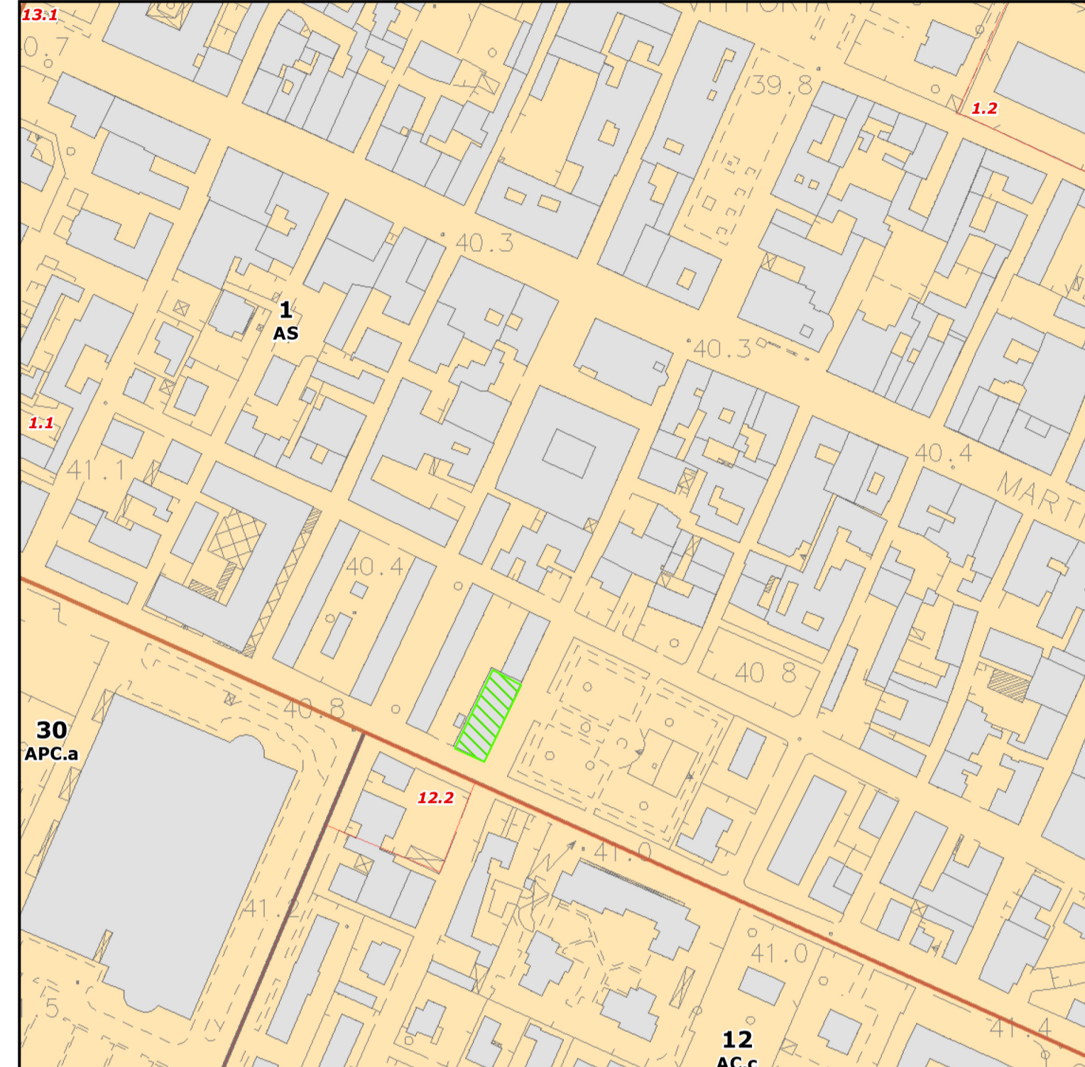
STRALCIO VINCOLO ESPROPRIATIVO - BASE ZONIZZAZIONE PSC