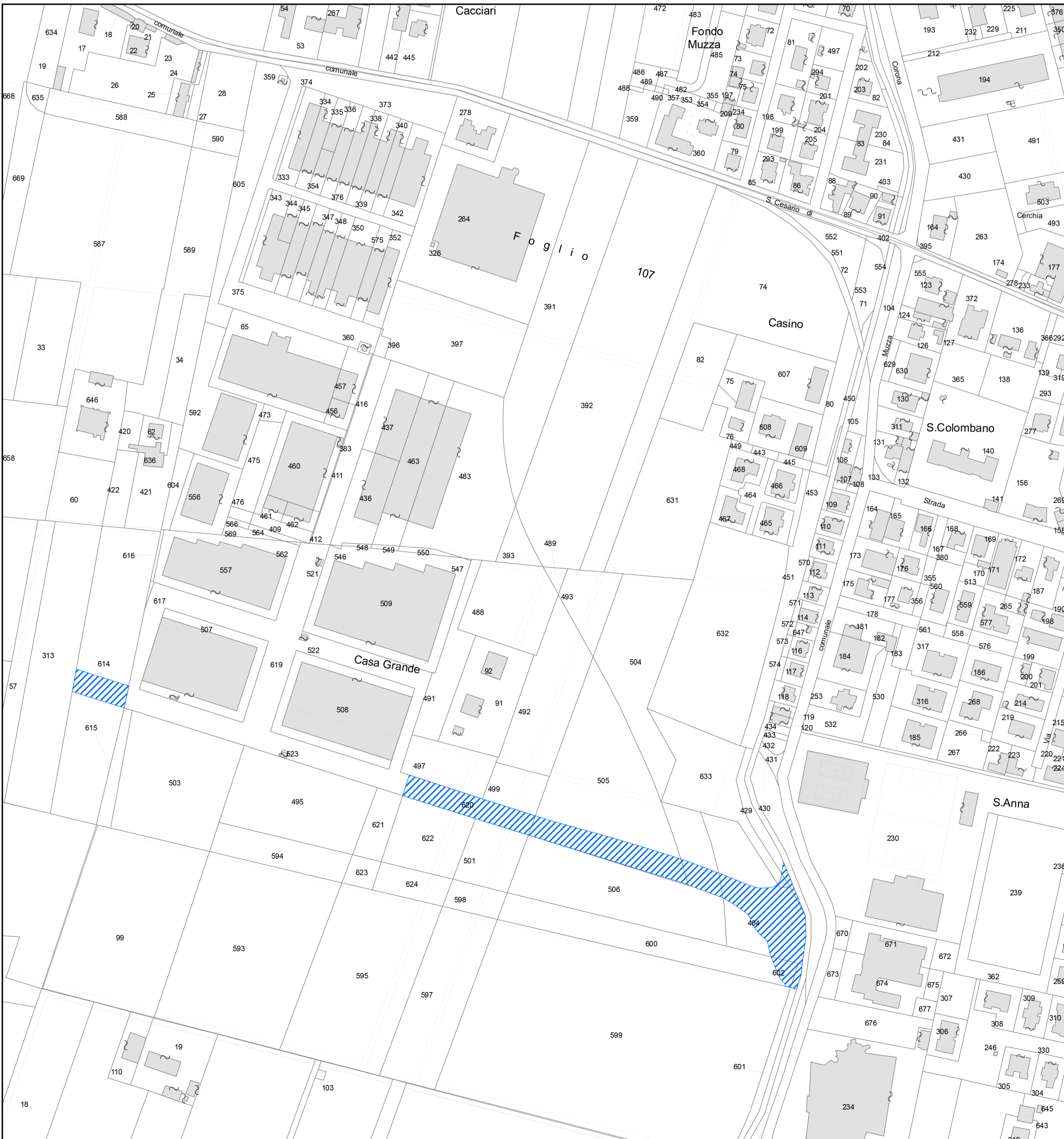
VINCOLO ESPROPRIATIVO - BASE CATASTALE