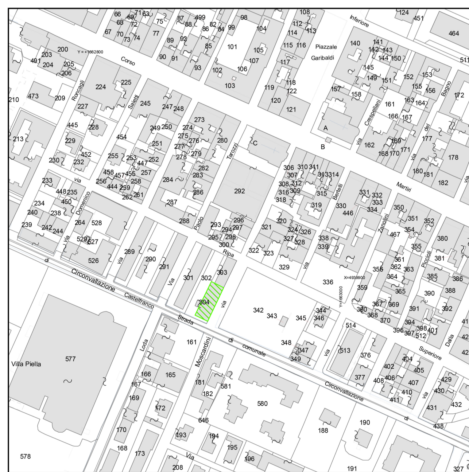
STRALCIO VINCOLO ESPROPRIATIVO - BASE CATASTALE