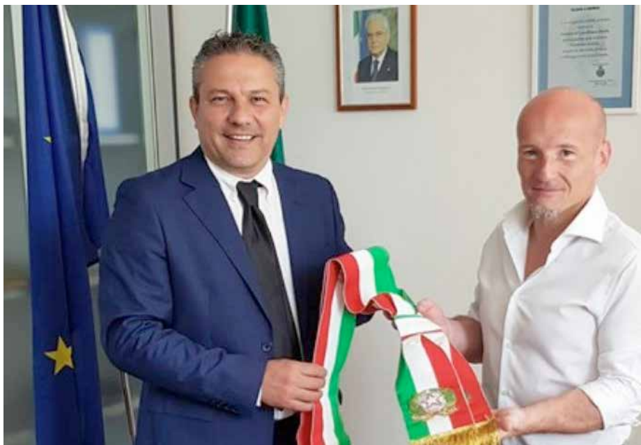
Il Sindaco di Castelfranco Emilia Giovanni Gargano

noi che il Comune sia il primo luogo di equità e che, col nostro esempio, si possa tutti insieme, promuovere ed alimentare quella coesione sociale che è il più grande patrimonio della nostra Città.