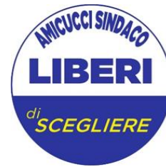
GRUPPO CONSIGLIARE "LIBERI DI SCEGLIERE" DI CASTELFRANCO EMILIA